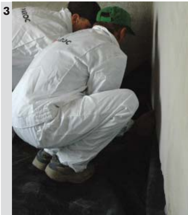
Właściwe ułożenie folii w narożach