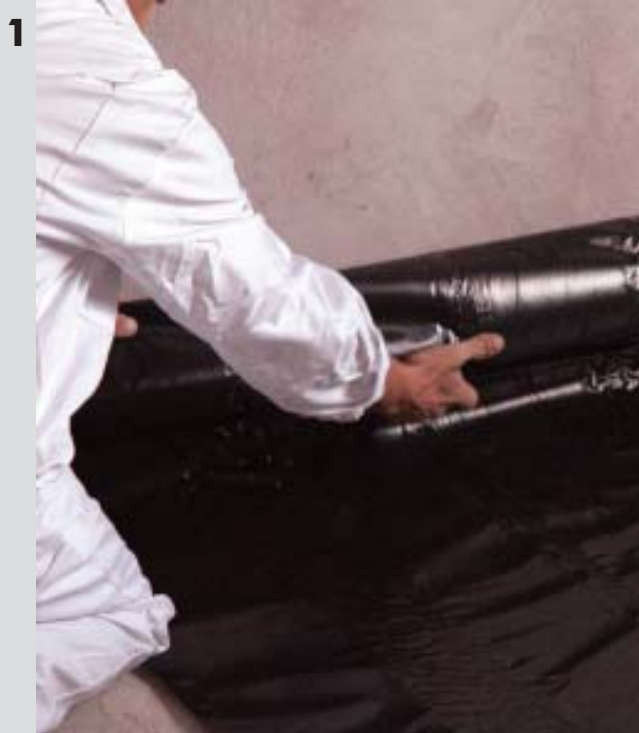
Ułożenie folii hydroizolacyjnej na posadzce